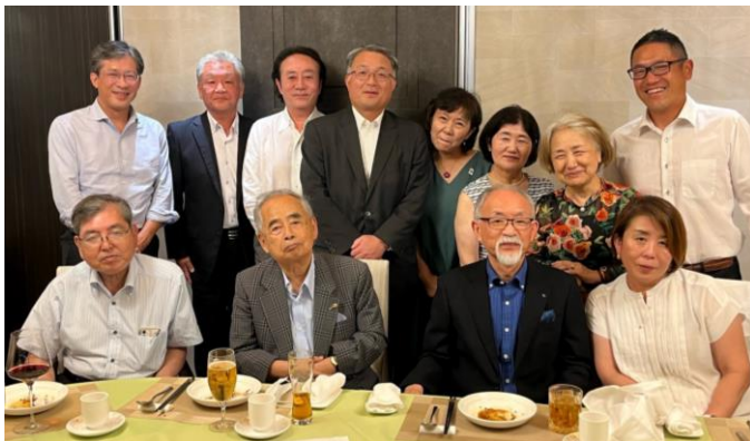
BIJテーブル 7月31日(月) 「老上海 陸氏厨房」