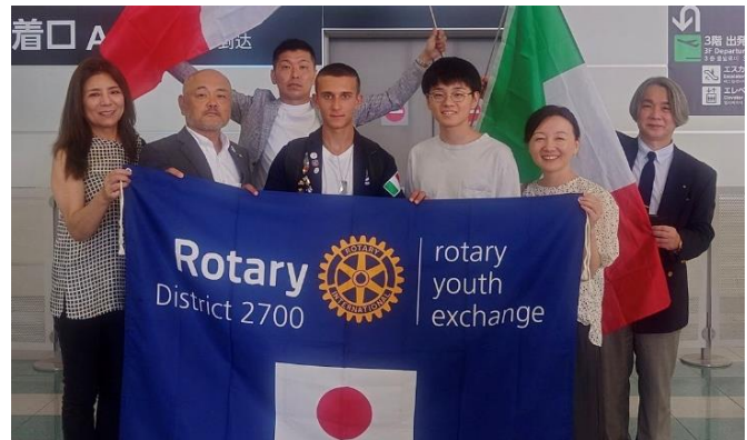
8月19日(土)イタリアよりウンベルト君が来日しました。約1年間よろしく願いいたします！