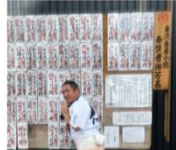
島根県松江市秋鹿町の漁村で、田中家の三男として生まれる

・新卒1年目は、富士ゼロックスの代理店で営業 ・2年で退職し、地元の歯科専門店でカリスで店員として働く ・27歳の時に現在の会社とご縁があり入社 →主に新機導入の立ち上げを担当(浜田、広島、山口、岡山、東京、京都) ・2021年7月に、株式会社福岡ビル開発の代表取締役へ就任